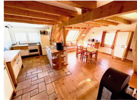
Wohnküche (mit 2er Schlafcouch)