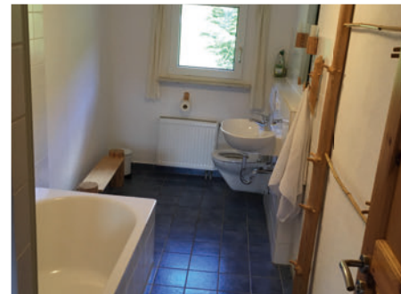
Bad mit Dusche/Duowanne